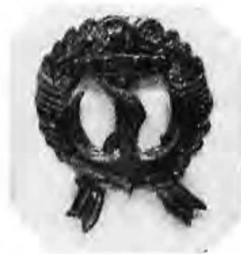
Abzeichen der III. Marine-Brigade von Loewenfeld